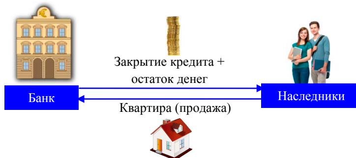
Рисунок 6. Заккрытие кредита

После смерти заемщика банк реализует имущество и закрывает кредит. В случае если квартира реализована дороже, чем долг по кредиту с процентами, остаток средств выплачивается наследникам.